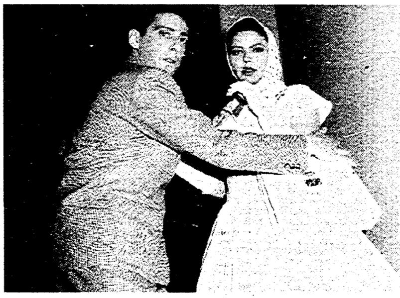
Sergio Castellitto e Ornella Muti in una scena de «Il grande Fausto»