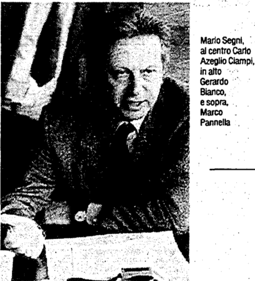
Mario Segni, al centro Carlo Azeglio Ciampi, in alto Gerardo Bianco, e sopra, Marco Pannella