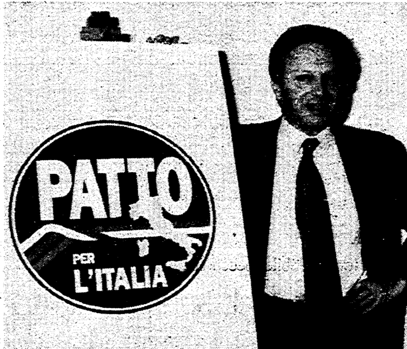
Segni presenta il simbolo del «Patto»

I prossimi appuntamenti del «Patto» saranno il 15 gennaio, a Roma, per la presentazione del programma da parte dell'apposito comitato e, il 5 febbraio, sempre a Roma, al Palazzo, per la prima manifestazione nazionale. Segni ha ribadito i suoi giudizi sul presidente del Consiglio. «Ciampi - ha detto - ha il dovere di non lasciare nei cittadini il dubbio che possa essere candidato per le sinistre alla presidenza del Consiglio. Quanto alla mozione di sfiducia, Segni interverrà nel dibattito. Sulla data delle elezioni ha detto che «una settimana in più o in meno non cambierà le cose». Segni ha ribadito la sua posizione sulla Lega e Berlusconi. «Noi - ha detto - lavoriamo alla costruzione del Patto, gli altri faranno le loro scelte». Per Occhetto e D'Alema solo critiche. «Lascio