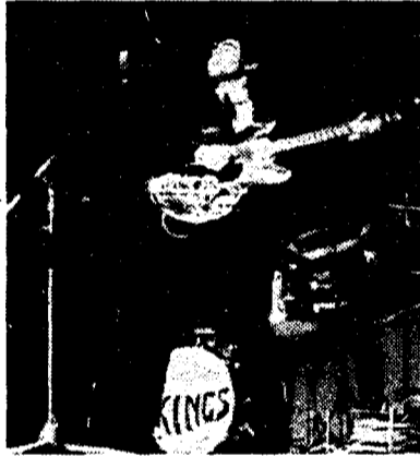
Una vecchia foto del Kings «storico» gruppo del beat italiano

Il Corriere della Sera dedica molto spazio alla faccenda e dice, pur con tono divertito, che il beat italiano fu un grande furto, ai limiti della truffa. Vero e non vero al tempo stesso. Scandalizzarsi per questi furti non ha senso: tutta la storia del rock'n'roll è una grande truffa, dagli albori, da quando bei ra-