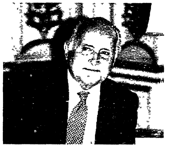
Il presidente della Repubblica Oscar Luigi Scalfaro. Al centro, il capo del governo Carlo Azeglio Ciampi mentre pronuncia il suo discorso in apertura del dibattito sulla mozione di sfiducia