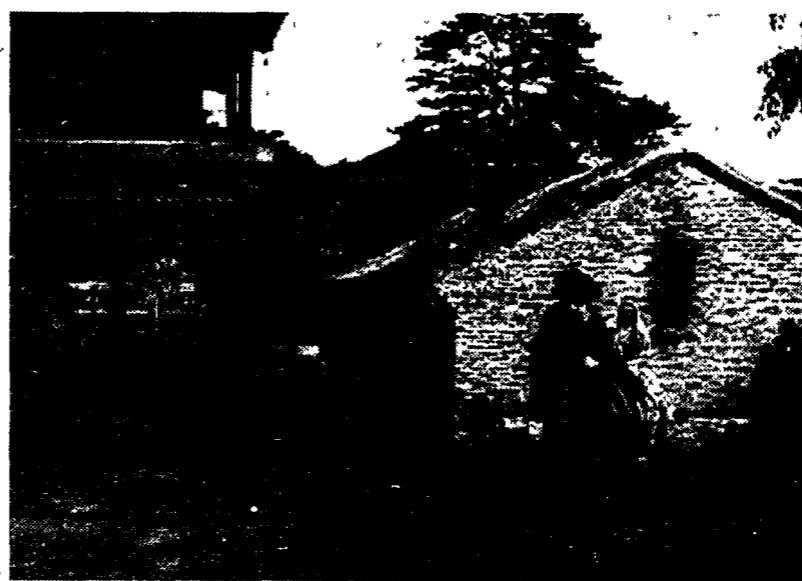
Una scena del «Marco Polo», coproduzione Rai

I tagli decisi ai budget della Rai colpiscono anche le coproduzioni. Raidue, per esempio, avrebbe a disposizione una decina di miliardi, quando una sola ora di film costa fino a un miliardo. «Congelate» alcune produzioni già in cantiere con la Rcs. Angelo Rizzoli polemizza: «Cosa se ne fanno dei miliardi di canone e spot? Pagano solo gli stipendi». Ma Marco Risi avverte: «Alla Fininvest è la stessa cosa».