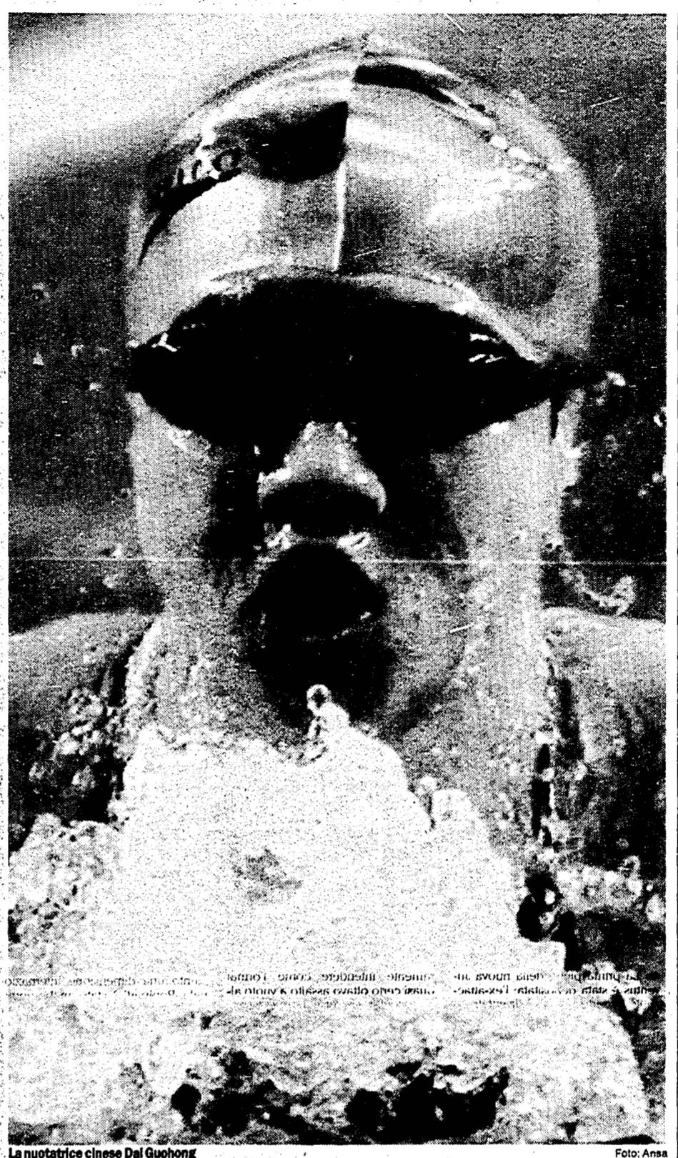
La nuotatrice cinese Dai Guohong