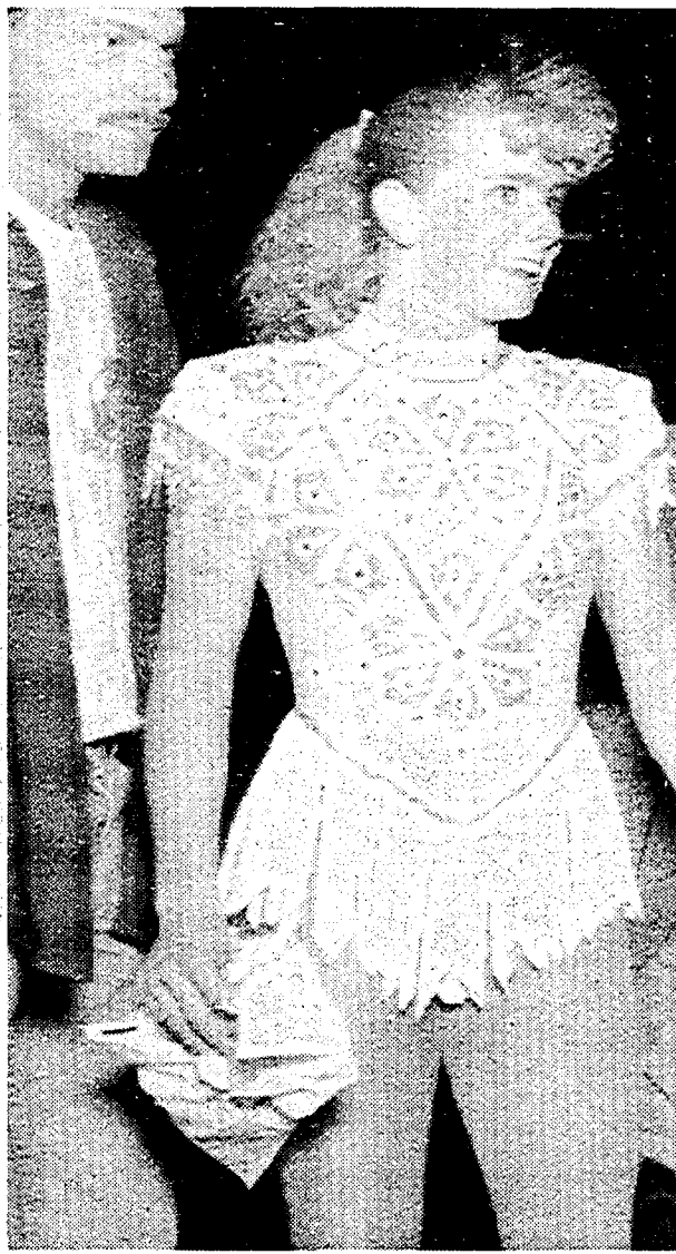
La pattinatrice Tonya Harding e suo marito Jeff Gillooly.

La Kerrigan, intanto, dopo il rischio corso, ha vinto un'altra battaglia: l'ex medaglia di bronzo ai giochi invernali del '92 ha recuperato appieno i traumi riportati nell'aggressione del 6 gennaio e l'altro ieri ha dimostrato sul ghiaccio di Detroit di essere in grado di gareggiare al 100%, ottenendo il «piacet» dei suoi tecnici.