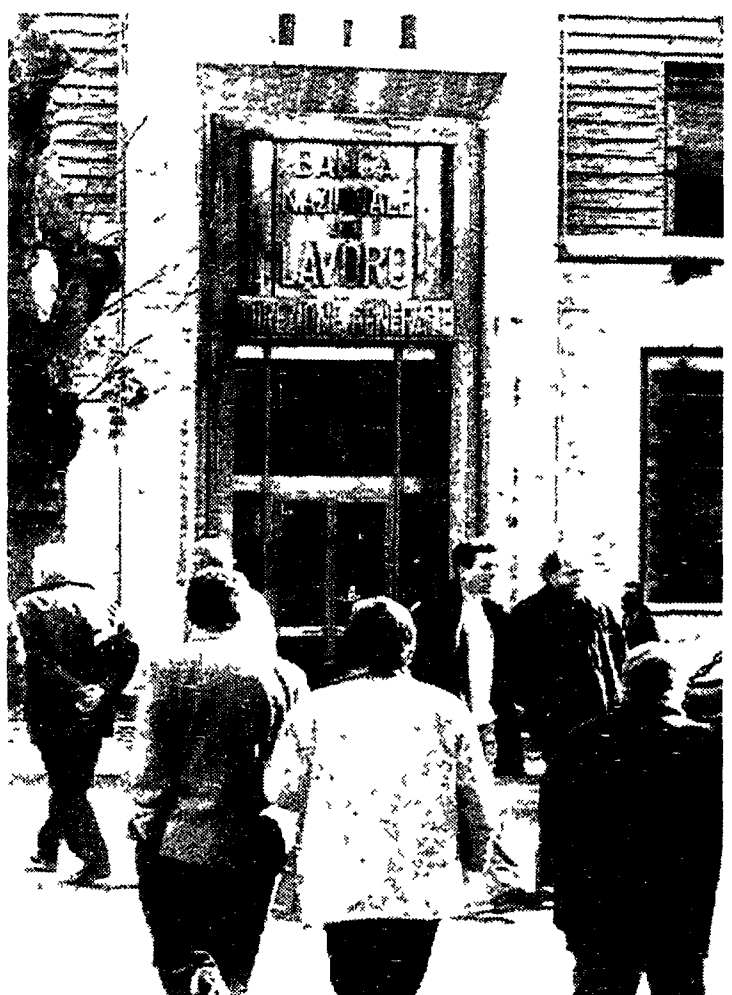
La sede centrale della Bnl a Roma

Al vertici di alcune grosse banche ci sono delle persone indagate. Che ne pensi? In alcuni di questi casi non vedo elementi di giudizio penalmente rilevanti. In ogni caso è opportuno un ricambio della dirigenza bancaria.