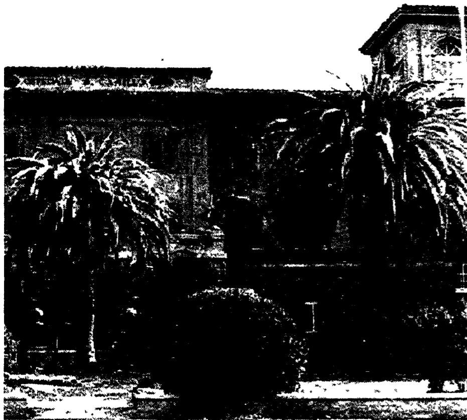
La direzione sanitaria dell'ospedale San Camillo