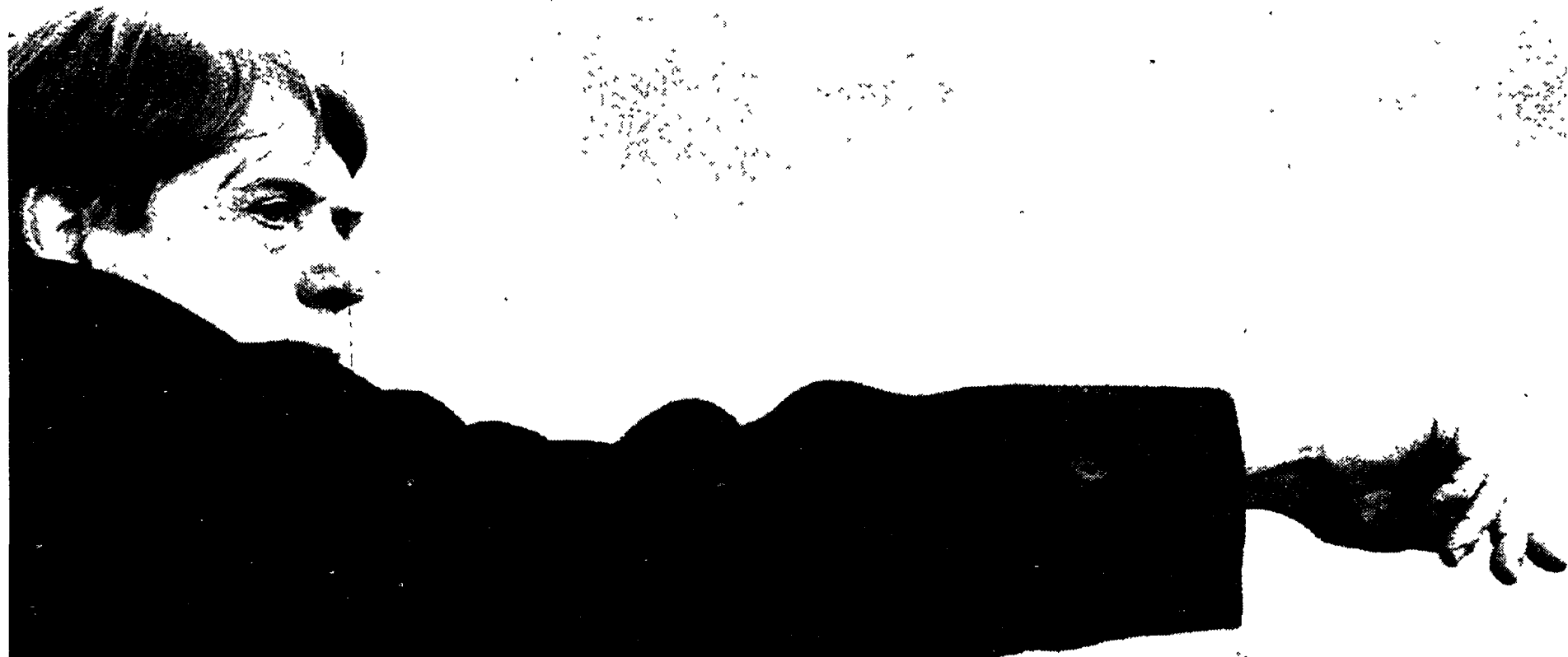
Cesare Maldini, commissario tecnico della Under 21 che stasera affronterà la Cecoslovacchia a Salerno

UNDER 21. Questa sera a Salerno (Raiuno ore 20,30) in campo gli azzurrini di Maldini