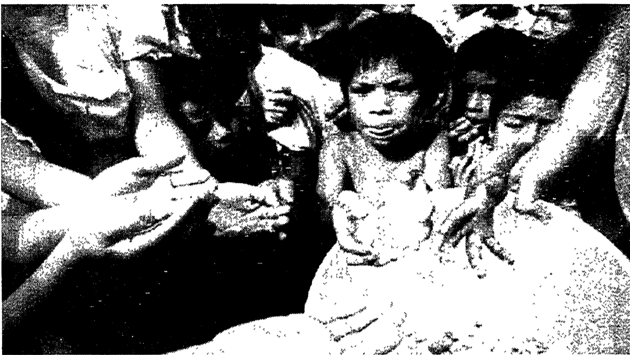
Bambini indios del Chapas ricevono cibo da membri di una organizzazione umanitaria