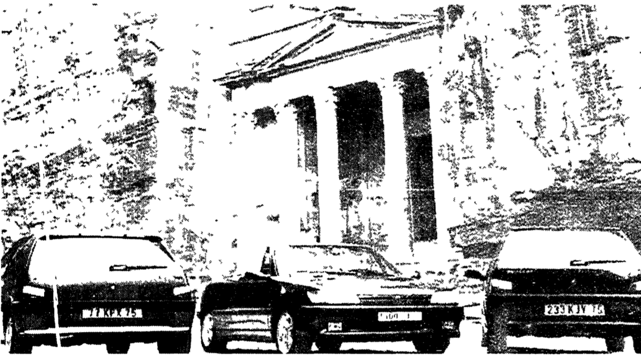
La 306 Cabriolet con le damigelle 106 davanti al Tesoro di Petra