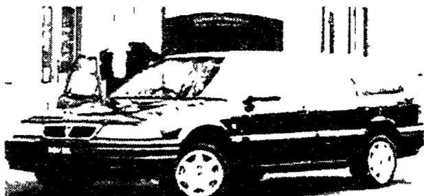
La nuova Rover 400 station wagon