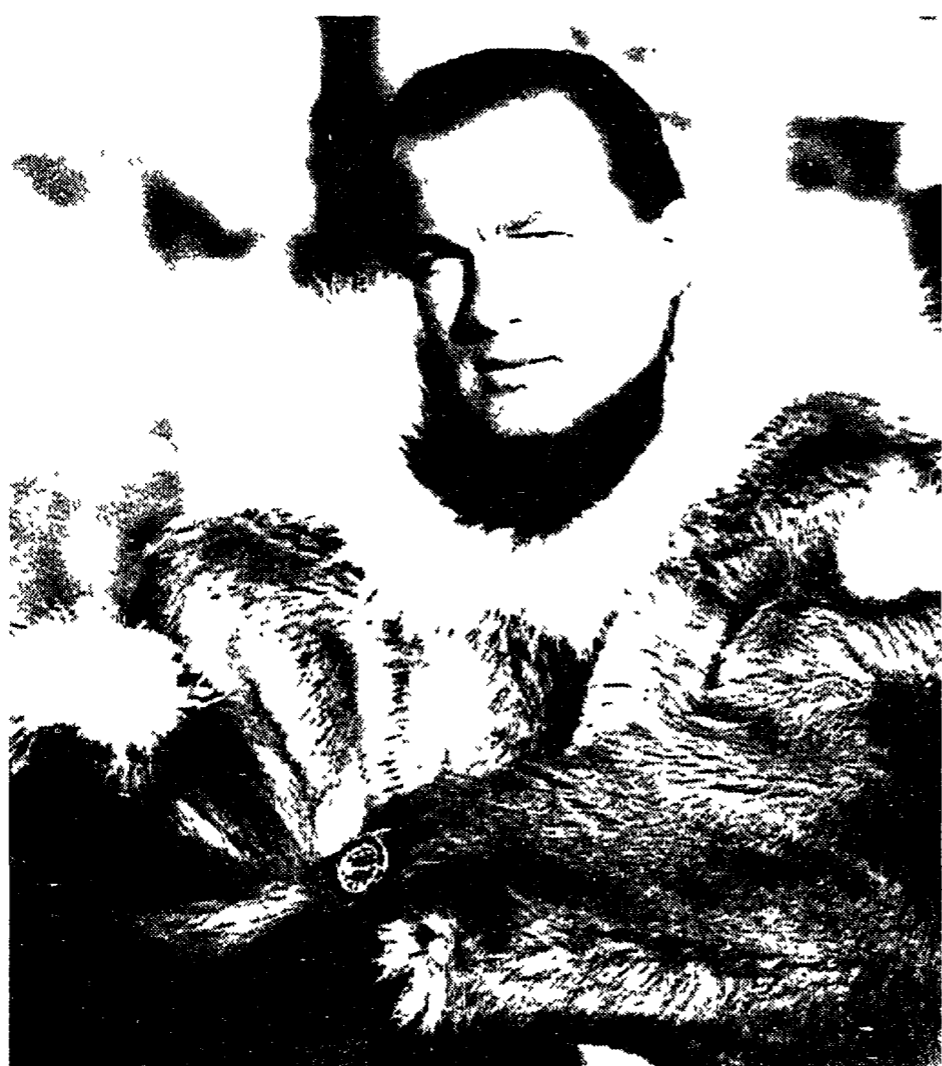
Steven Seagal in «Sfida tra i ghiacci».