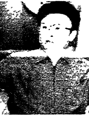
Kim Jong Il