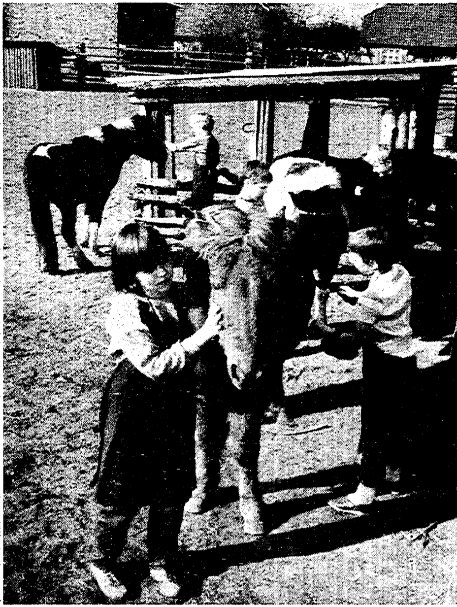
Vivere in campagna: bambini e cavalli