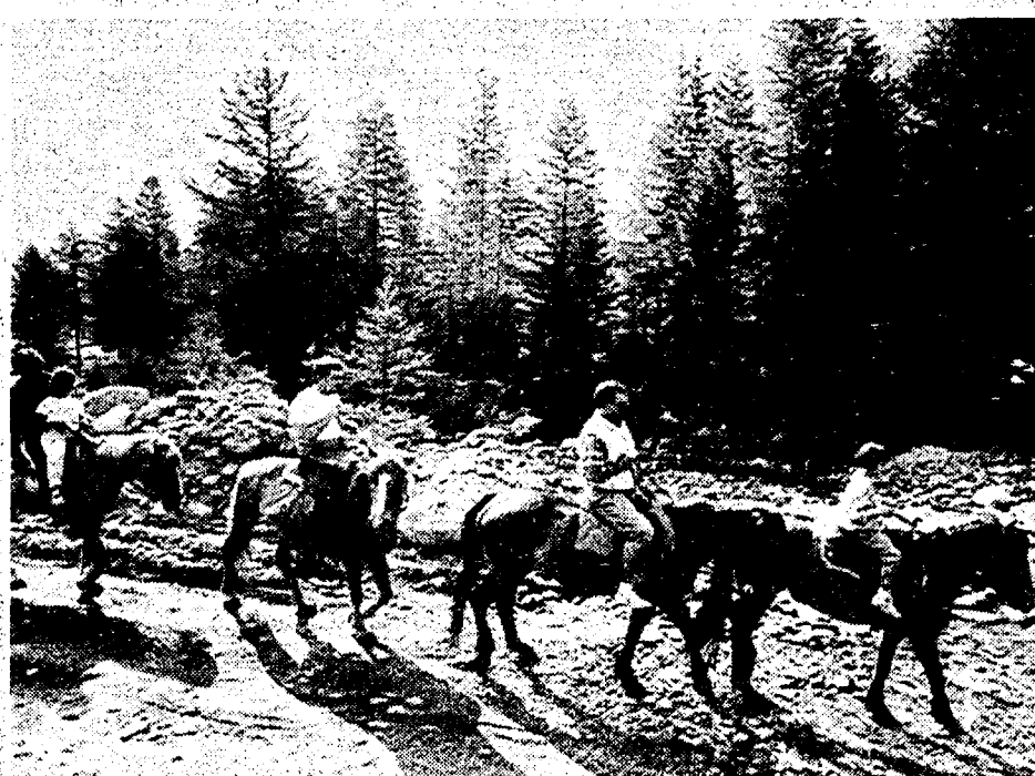
A cavallo: uno dei modi più apprezzati di fare agriturismo

Accantonato da tempo l'empirico sistema del «passaparola», quando per ottenere «l'indirizzo giusto» ci si affidava al solito amico «bene informato», ecco la «Guida all'Ospitalità Rurale - Agriturismo e Vacanze Verdi». Edizione Sepe, lire 35.000, comprensive di quota associativa. La guida è pubblicata dall'Agriturist (Associazione Nazionale per l'Agriturismo, l'Ambiente e il Territorio), fondata a Roma nel '65 con precisi intenti culturali e paesaggistici, e con lo scopo di promuovere e coordinare la valorizzazione dello spazio rurale in termini produttivi: alla