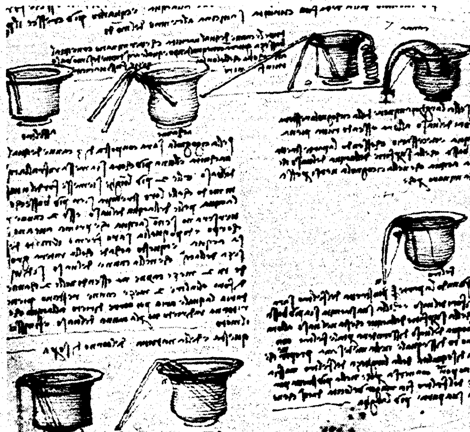
Due studi leonardeschi tratti dal codice Hammer. In basso il collezionista Armand Hammer