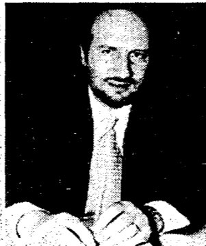
Marco Venturi M. Merlini/Elfigo

Favoriscono la grande distribuzione tra cui anche la Standa. Potrebbe diventare un problema. Comunque, giudicheremo Berlusconi dagli atti concreti. La piccola e media impresa commerciale è un