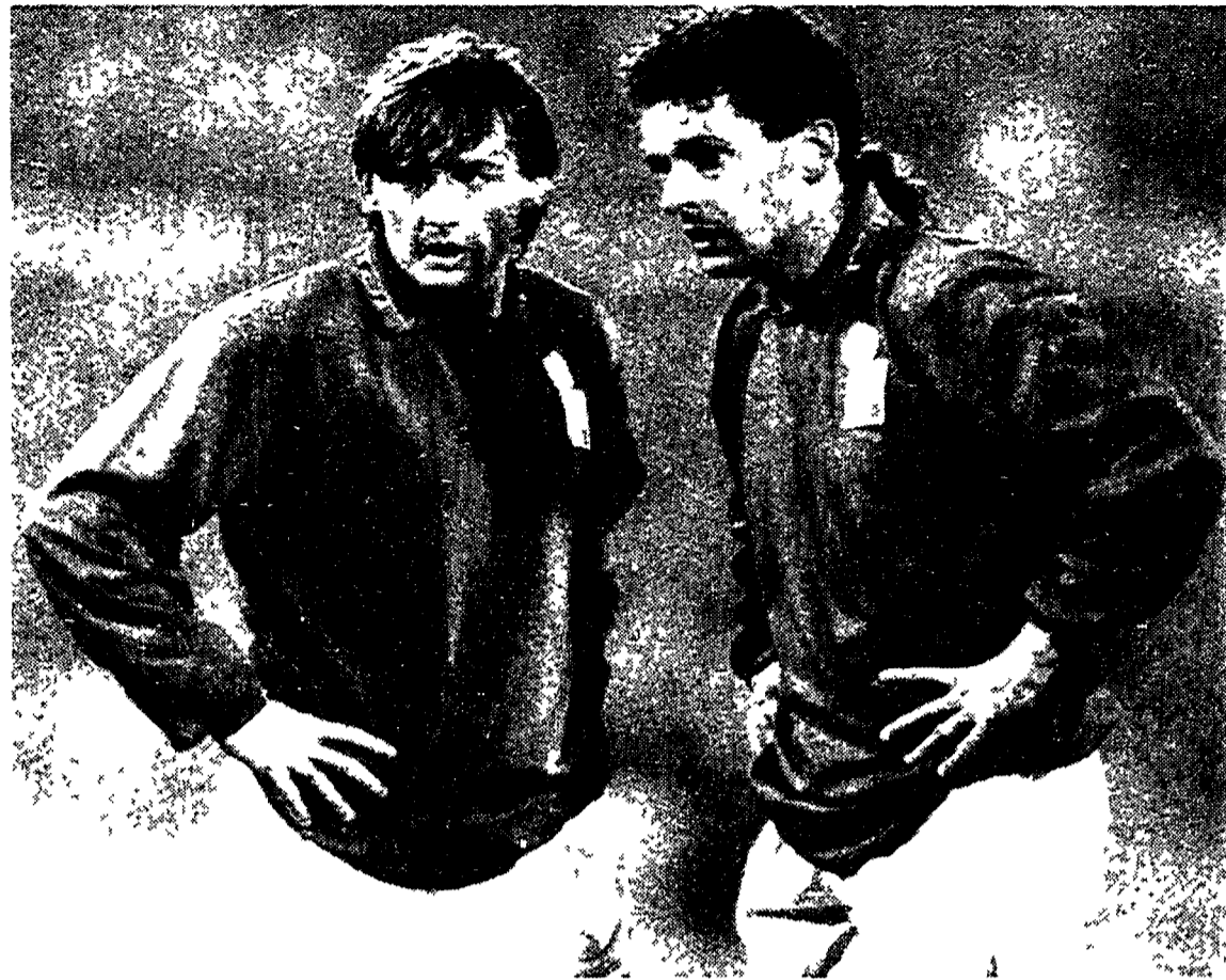
Beppe Signori e Roby Baggio, i «gioielli» dell'Italia Mondiale