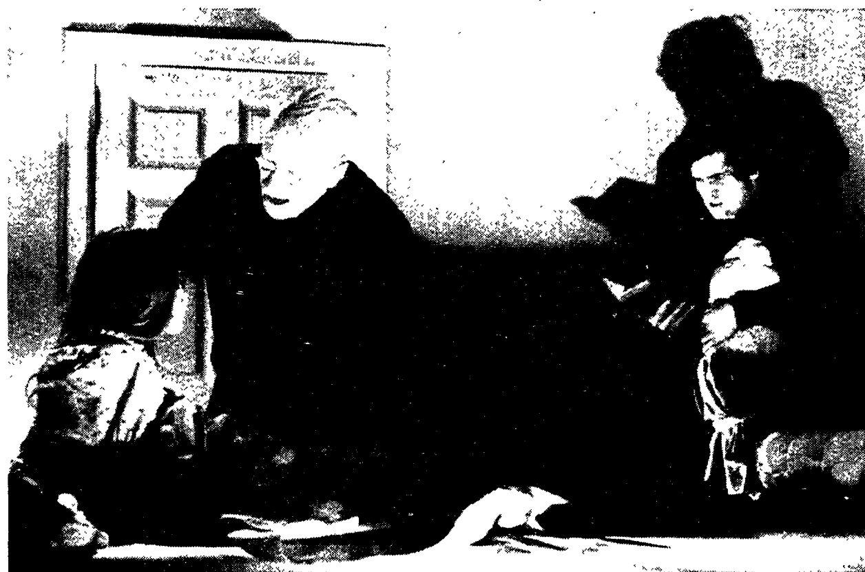
Una scena del film «L'esorcista»