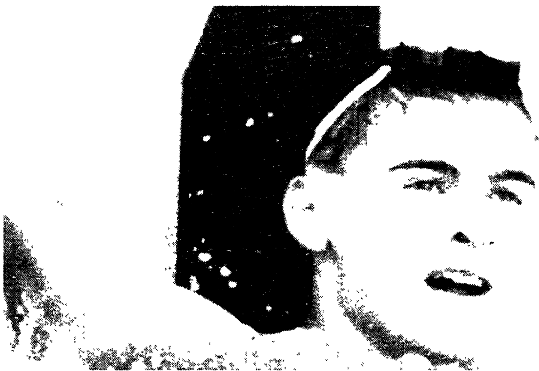
Il russo Alexander Popov nuovo primatista del mondo dei 100 stile libero

SCHIO (Vicenza) - Un'altra tragedia nell'automobilismo agonistico. Una persona è rimasta uccisa e un'altra gravemente ferita in un incidente avvenuto durante una prova speciale del Rally Automobilistico "Citta di Schio". Una delle vetture iscritte alla gara, una Peugeot 309 Gh, ha investito alcuni spettatori mentre stava affrontando una curva. Non è ancora chiaro se sia stata l'automobile ad uscire di strada o siano stati gli spettatori ad invadere la carreggiata convinti che tutte le vetture in gara fossero ormai passate. Il Rally è stato immediatamente sospeso. L'incidente è avvenuto nel primo pomeriggio di ieri a Santa Caterina di Poleo, una località molto vivina a Schio. La vettura coinvolta è stata posta sotto sequestro dalla polizia stradale di Schio.