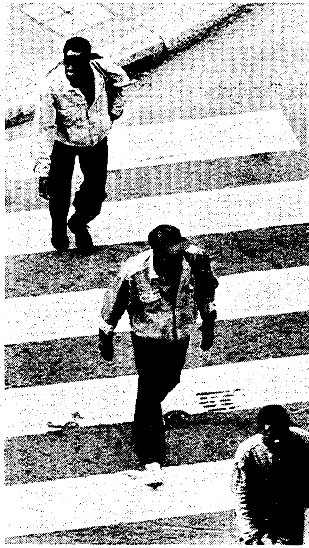
Immigrati a Milano. Uliano Lucas