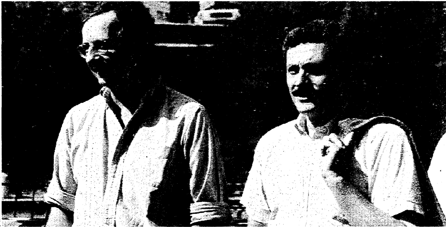
Walter Veltroni e Massimo D'Alema