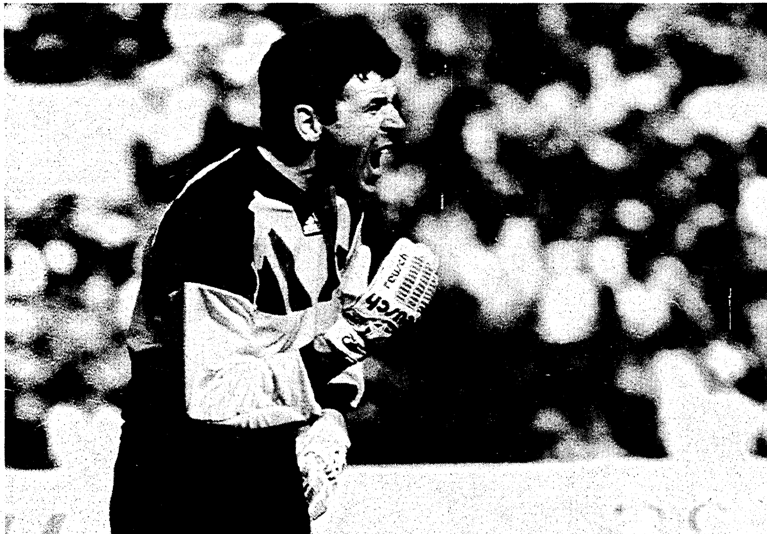
Il portiere dell'Irlanda Pat Bonner; a lato Bergkamp e Houghton