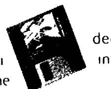
IL FLOPPY DISK CONTIENE GLI INDICATORI ECONOMICI

Dall'agricoltura alla zootecnica, da un servizio finanziario ad una consulenza, tra le voci dell'Annuario Seat c'è sicuramente quella che cercate per aumentare il vostro volume di affari. Vero punto d'incontro dell'economia italiana, l'Annuario Seat raccoglie ad ogni edizione un coro di consensi. Lo dice il sondaggio effettuato tra i suoi consultatori: completezza, facilità di ricerca, una altissima frequenza d'uso e una elevata percentuale di contatti che si concludono in affari. Con i suoi dodici volumi, nove