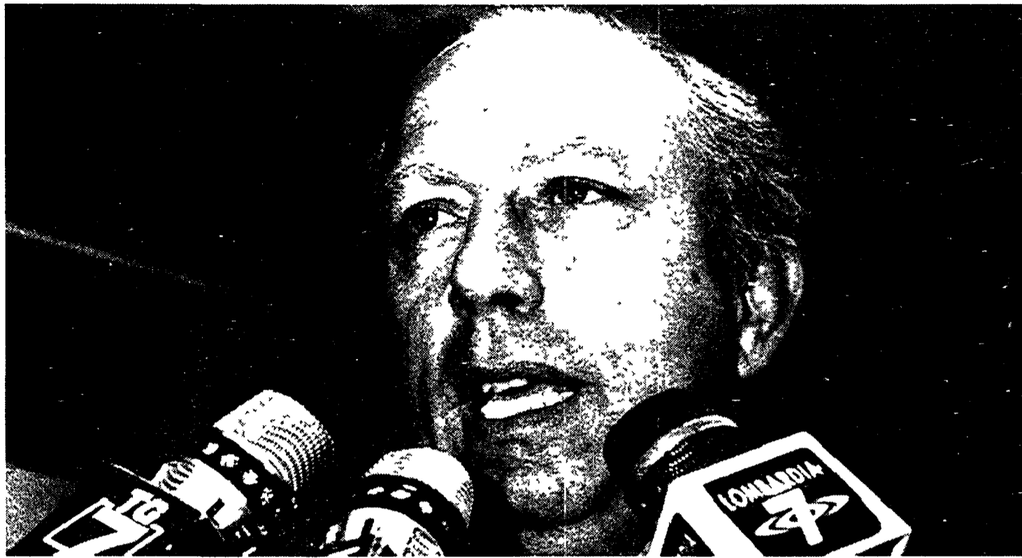
Ottavio Bianchi, nuovo allenatore dell'Inter