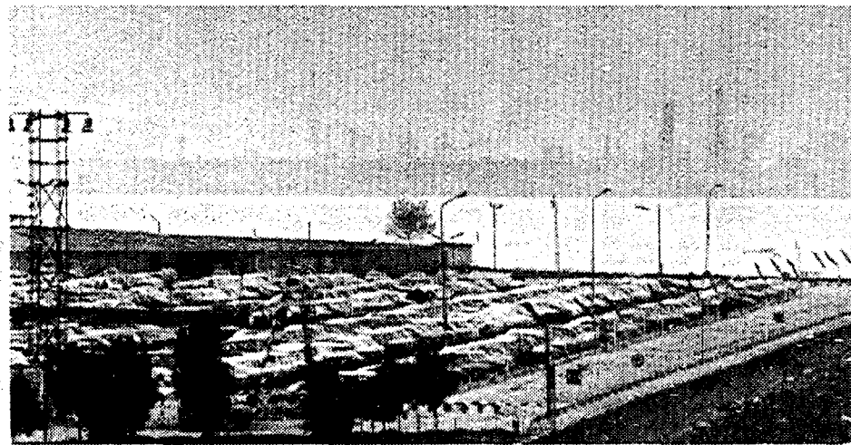
Il parcheggio del Tronchetto a Venezia