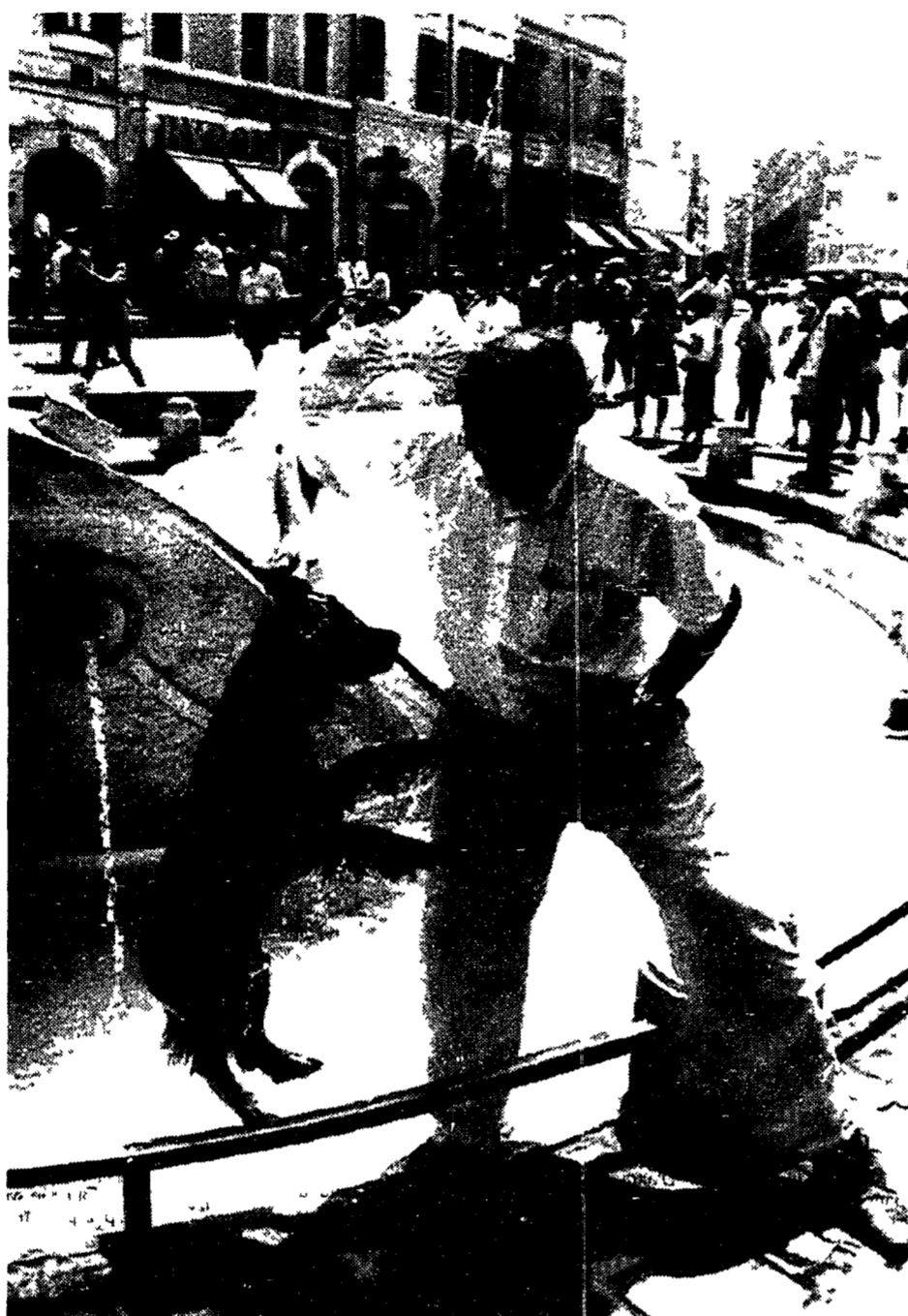
Il caldo è tanto e per il proprio cane ci vuole un bel bagno nella fontana

Il caldo-record persiste favorendo il ristagno dei miasmi inquinanti. Preparamoci dunque ad affrontarlo per minimizzare i danni.