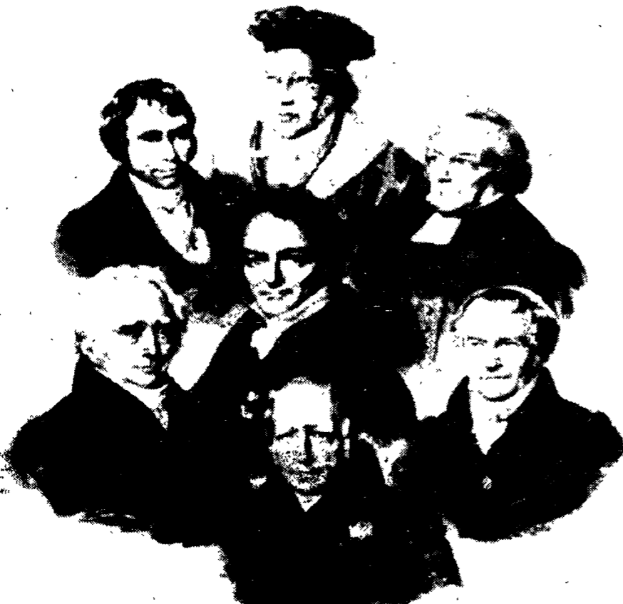
Hegel, in alto con i dotti di Berlino. A lato, Stoccarda, città natale di Hegel.

nico. La storia è servita a questo, a fare intendere all'uomo che egli è libero e lo è per essenza. Naturalmente questo è un fatto culturale, una presa di coscienza. Non si vuol dire che in realtà tutti sono liberi nel mondo moderno, si vuol dire che la condizione di non libertà non è giustificabile o, che è lo stesso, non è razionale. E bisogna aggiungere che questo processo è tutt'altro che una marcia trionfale: ha costi umani spaventosi (la storia è un mattatoio, dice Hegel) e concerne un numero assai limitato di fatti storici, ossia concerne soltanto quei fatti storici che, a giudizio di Hegel, sono stati portatori di senso, cioè hanno contribuito alla presa di coscienza della libertà.