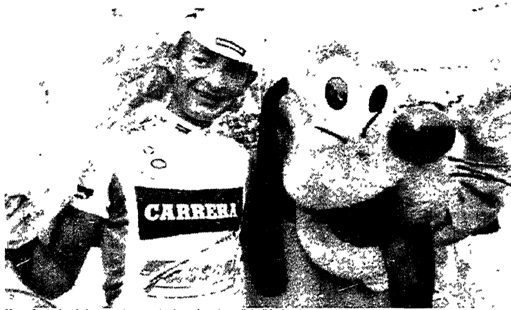
Marco Pantani sarà sicuramente presente, domenica, al mondiale di Agrigento

L'Italia dei dilettanti (uomini e donne) ha deluso nelle due prove su strada sul circuito di Capo d'Orlando dei campionati mondiali di ciclismo in Sicilia. Gli azzurri non sono riusciti a conquistare nemmeno una medaglia, mentre è stata una giornata di festa per i «nordici», che tornano a casa con due ori. In campo femminile la gara sembrava essersi messa bene per la lucchese Michela Fanini, una velocista molto quotata per gli arrivi in volata: a meno di due chilometri dal termine, la ciclista toscana era nel gruppo di testa, ma è rimasta coinvolta in una caduta su una curva in discesa e non ha potuto quindi partecipare allo sprint per il successo. La prova è stata vinta dalla potente norvegese Vahvi, che nel rettilineo finale ha avuto la meglio sulla belga Maeghtman, seconda, e sulla statunitense Golay, terza. Prima delle azzurre è arrivata la Chiappa, quinta. Tra gli uomini, il titolo iridato è andato al danese Pedersen, che in volata ha preceduto lo slovacco Dvorsky e il francese Mengin. Il vicentino Pianegonda è arrivato quarto.