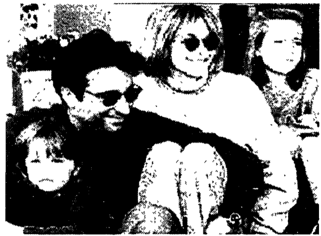
Andy Garcia e Meg Ryan nel film «Amarsi».

QUANDO UN UOMO ama una donna può accadere di tutto: anche che una coppia minata dall'alcolismo riesca a uscire dall'incubo per fondare una nuova armonia.