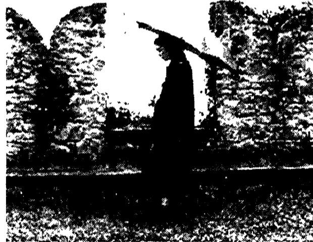
Una scena del film «Piccoli orrori».

La manifestazione, che si è conclusa domenica nella cittadina toscana, è organizzata dal Cut! (Coordinamento ultime tendenze, una delle associazioni rappresentative degli autori, e dei tecnici cinematografici italiani) e diretta da