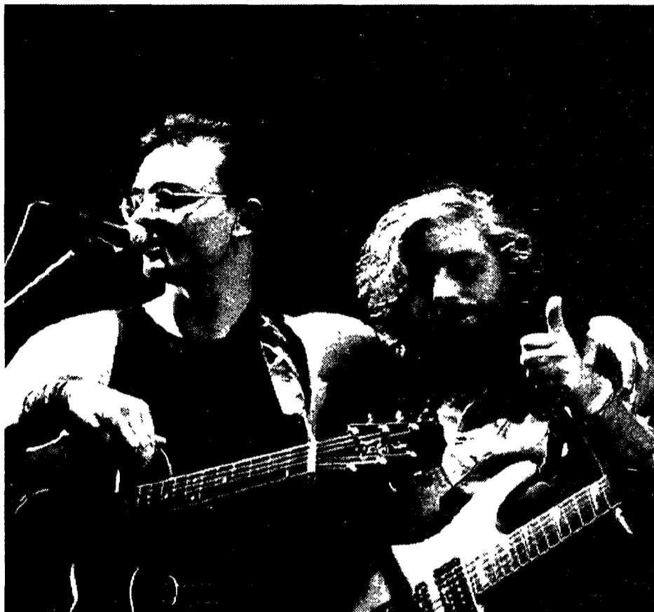
«Nomadi» in concerto a Firenze nell'aprile scorso.