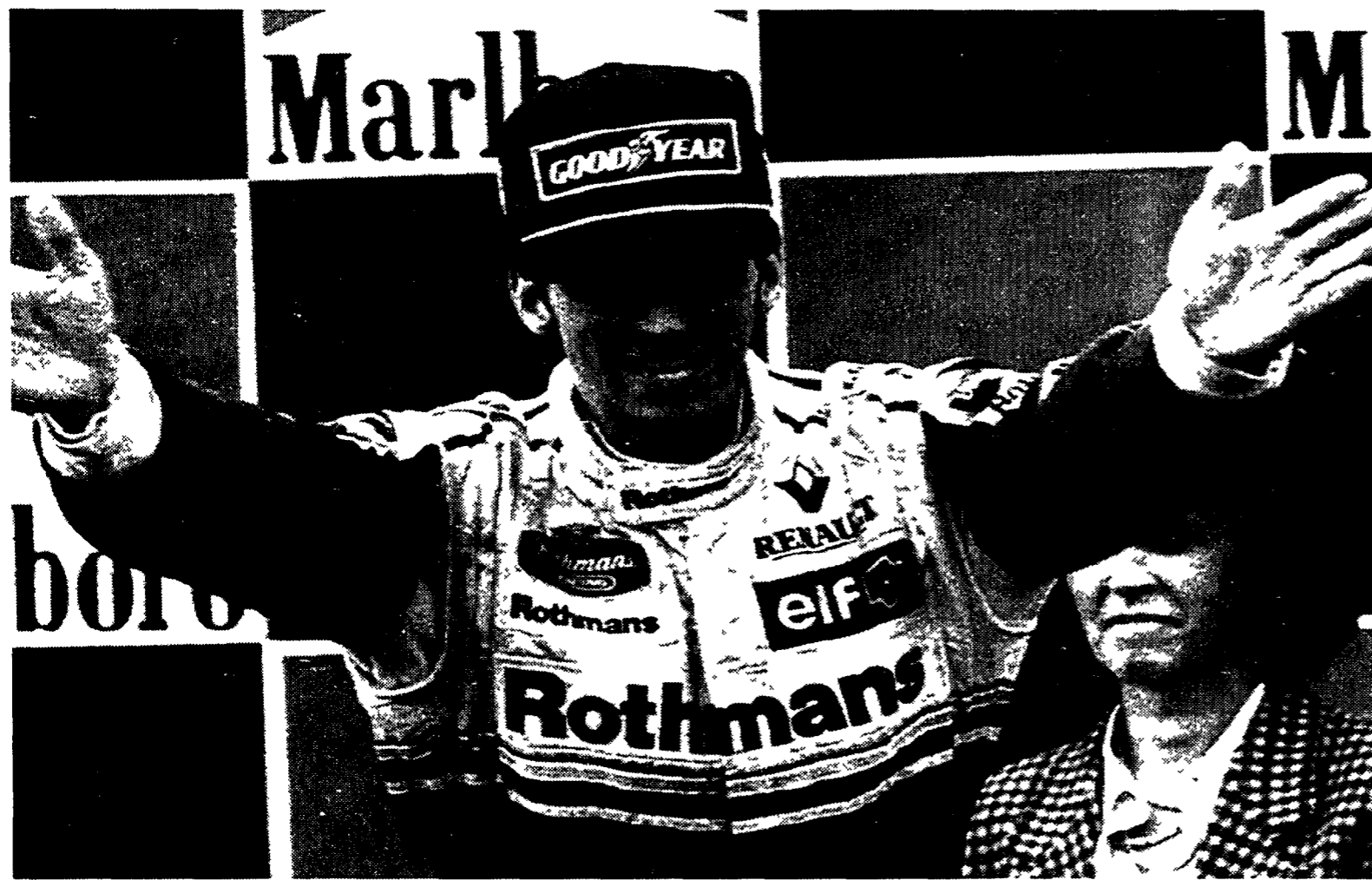
Damon Hill è a un passo dal leader della classifica mondiale, il tedesco Schumacher. Sotto Berger

FORMULA 1. Hill vince all'Estoril: è a un punto da Schumacher nel mondiale. Ferrari ko