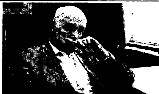
Svatoslav Richter 5 ottobre 1994, Torino Auditorium del Lingotto

Centro Servizi e Spettacoli di Udine via Grazzano 6 - 33100 Udine tel. 0432/504765 fax 0432/504448