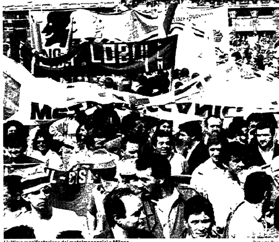
L'ultima manifestazione dei metalmeccanici a Milano