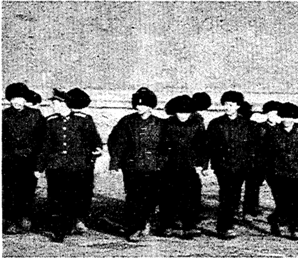
Pechino. Gruppo di militari in visita alla Città Proibita. Lello Granelli

Lasiatevi andare alle vostre emozioni, fidatevi delle vostre sensazioni, un viaggio in Cina non deve essere per forza affrontato come un freddo e razionale apprendistato di sinologia: dopo tanti anni vissuti in quelle terre lontane, con un rapporto di odio-amore saldamente consolidato, è questo il consiglio che mi sento di dare a quanti sono pronti ad accogliere l'invito dell'Unità e si apprestano a visitare un paese che non ha più un solo volto. Pechino, la grande capitale, Xian, uno dei centri archeologici più affascinanti del mondo, i remoti villaggi dello Yunnan dove abitano i cinesi non di razza Han: ecco una miscela faticosa, ma capace di offrire una veduta di insieme delle tante anime della Cina di oggi. Un percorso non banale, per turisti un po' speciali, ai quali L'Unità non si limita a offrire la professionalità e la competenza di quelli che per mestiere si occupano di liberare il viaggiatore da ogni incombenza relativa ad alberghi e aerei. Offre qualcosa di più: la possibilità che le sensazioni da turista non si fessino solo nelle foto, sfidino più compiutamente la fantasia, segnino più nel profondo la memoria.