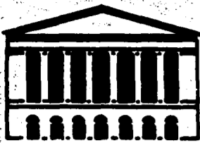
Una veduta della Casina dell'Algardì a Villa Pamphili Rodrigo Pais

Visite guidate, mostre, rassegne: ecco cosa c'è da vedere E a Vallelunga auto d'epoca, saltimbanchi e antiquariato