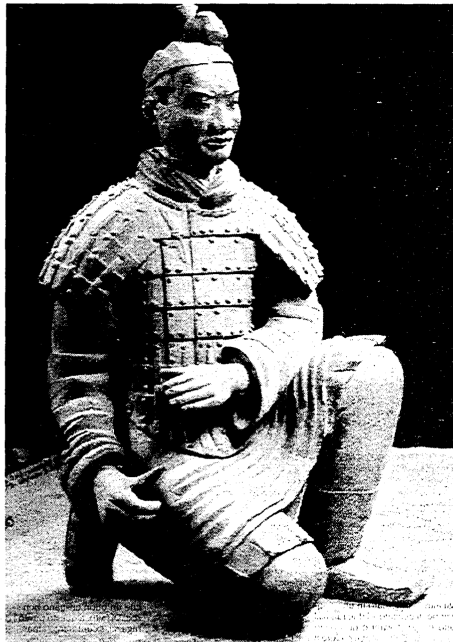
Un balestriere in ginocchio in terracotta appartenente al gruppo dei Guerrieri di Xian