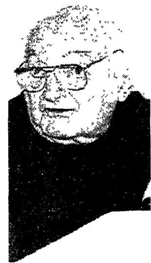
Lo scrittore Stefan Heym