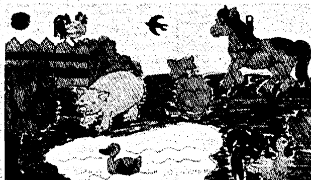
Una fattoria dove trascorrere il tempo libero