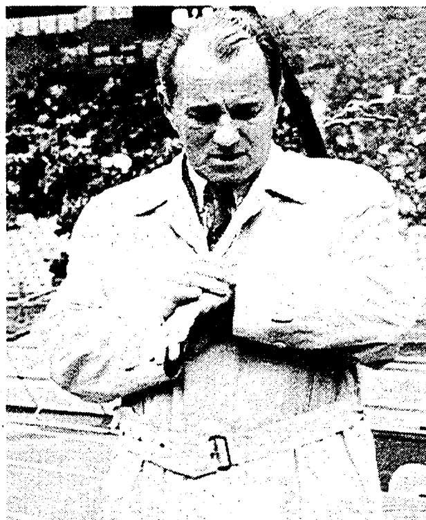
Vujadin Boskov, ritorno all'Olimpico da allenatore del Napoli

Quale Lazio vedremo oggi pomeriggio a Reggio Emilia contro la Reggiana? Quella irresistibile che venti giorni fa ha travolto il Napoli? O quella spastica che tante volte si è vista nel mercoledì di coppa? O, ancora, quella che domenica scorsa ha faticato per superare all'Olimpico la Cremonese? Chissà. Chamot e Winter sono squalificati, ma il tecnico Zeman, come al solito, non sembra preoccupato. Del resto, secondo lui nessuno è indispensabile. Con ogni probabilità il modulo difensivo sarà composto, da destra verso sinistra, da Negro, Cravero, Bergodi e Favilli. E Zeman, per superare la Reggiana, punta proprio sugli inserimenti in avanti dei due estermi. A centrocampo al posto di Winter ci sarà Venturin, mentre per il tridente, accanto a Boksic, Singori, c'è il solito ballottaggio tra Casiraghi e Rambaudi. La squadra emiliana ha cambiato allenatore questa settimana. Marchioro è stato sostituito da Ferrari. E il nuovo arrivato ha affermato che la Reggiana scenderà in campo per vincere. Sarà, ma finora i granata emiliani hanno sempre giocato un calcio molto difensivo, quasi «catenaclacaro», proprio quello di calcio contro cui la Lazio si batteva in difficoltà. In ogni caso l'ambiente biancoazzurro è tranquillo: dall'aiuto del secondo posto in classifica, Signori e compagni non hanno paura di nessuno.