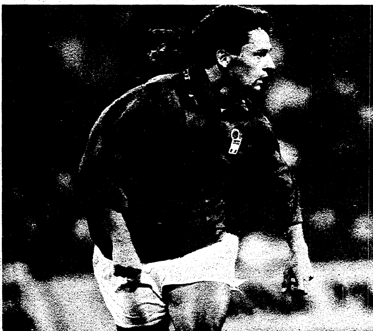
Roberto Baggio convocato da Sacchi per l'incontro con la Croazia