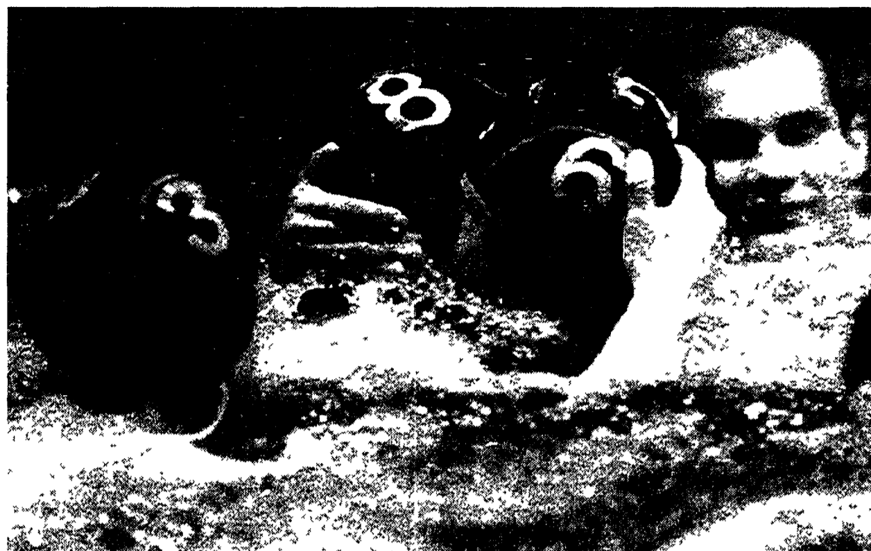
Oggi riparte il campionato di pallanuoto. Nella foto la nazionale azzurra vincitrice degli scorsi mondiali a Roma