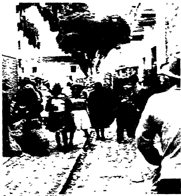
Cusco: il mercato di Chincheros

viaggi individuali e di gruppo in Italia e all'estero crociere e soggiorni al mare e ai monti notizie e curiosità dove, quando e a quanto