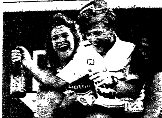
Berzin sorridente ai tempi del Giro d'Italia. Ora il futuro è in mano agli avvocati

Un altro velocista che ha deciso di cambiare colori della maglia è Enrico Leon, il veneziano che a Bologna ha indossato la