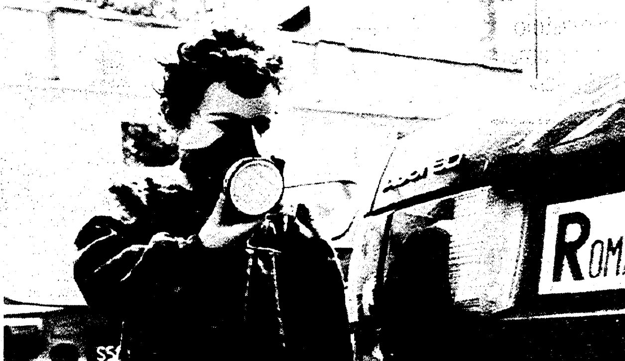
Antonio Bozzardi/Nuova Cronaca