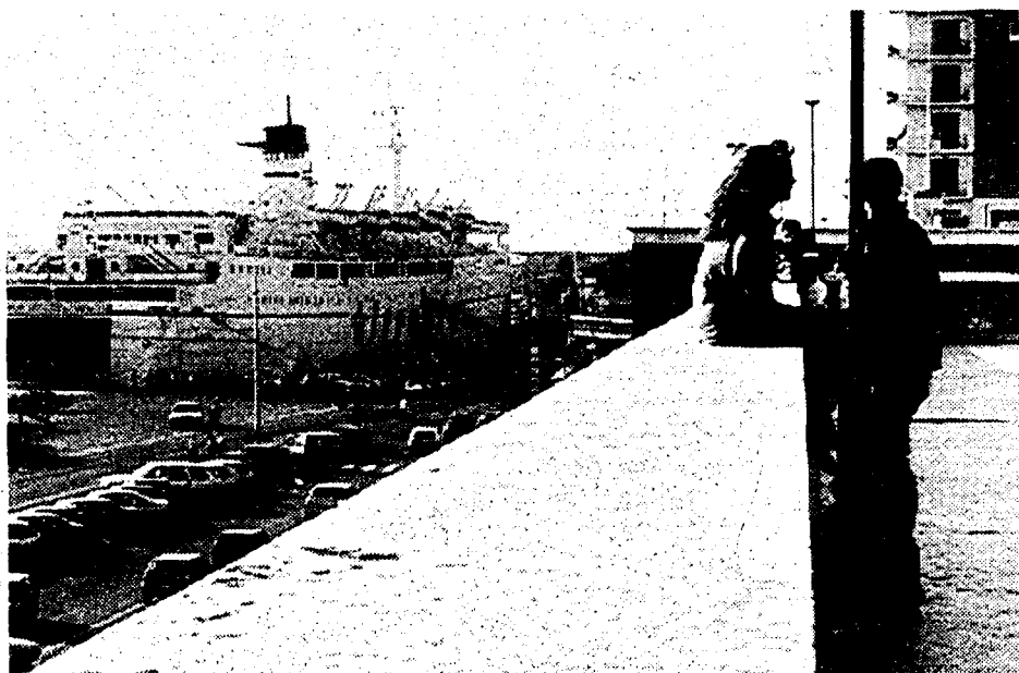
Una veduta del porto di Civitavecchia

domenica conterà molto il voto d'opinione sul candidato. In questo senso Tidei parte in vantaggio perché può contare su un vasto fronte a sinistra, che si è ricompattato contro il rischio che venga eletto sindaco il candidato sostenuto con forza da Alleanza nazionale. Per il candidato della destra non ha funzionato l'effetto novità. Già al primo turno Caruso ha pagato il pesante prezzo dell'impopolarità del presidente del Consiglio Berlusconi e dei limiti delle sue proposte programmatiche con il crollo di Forza Italia, passata dal 33% delle Europee all'8,4%. Resta da valutare l'incognita dell'astensionismo e delle schede nulle, già consistenti al primo turno. Ieri presso l'ufficio elettorale del Comune si sono fermate lunghe code in quanto molte persone avevano dimenticato di conservare il certificato elettorale per il secondo turno.