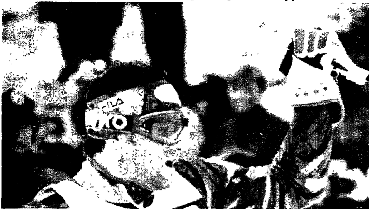
Alberto Tomba vincitore del primo slalom di stagione

SCI. Alberto domina lo slalom di Tignes e guida la Coppa del mondo