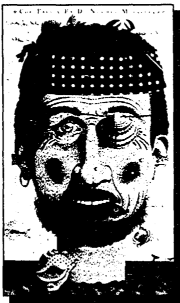
Mille e più facce da scoprire in un gioco buffo e divertente