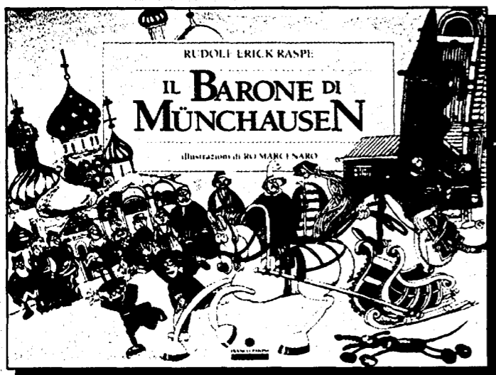
Il barone più famoso del mondo visto con gli occhi di Ro Marcenaro