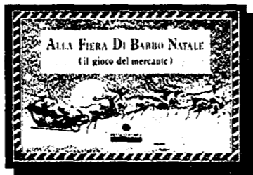
Un gioco famosissimo in versione natalizia adatta ai più piccoli