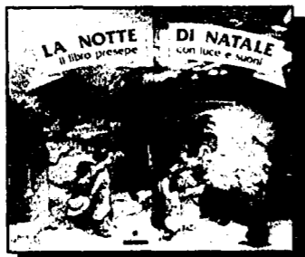
Un libro da smontare per costruire un presepe ricco di luci e suoni