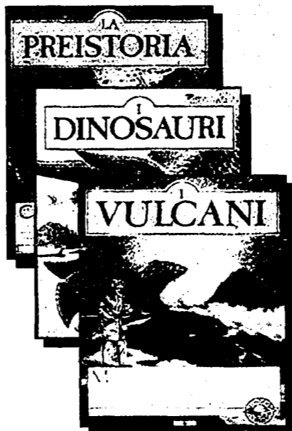
Libri monografici che uniscono la precisione scientifica alla meraviglia delle immagini tridimensionali