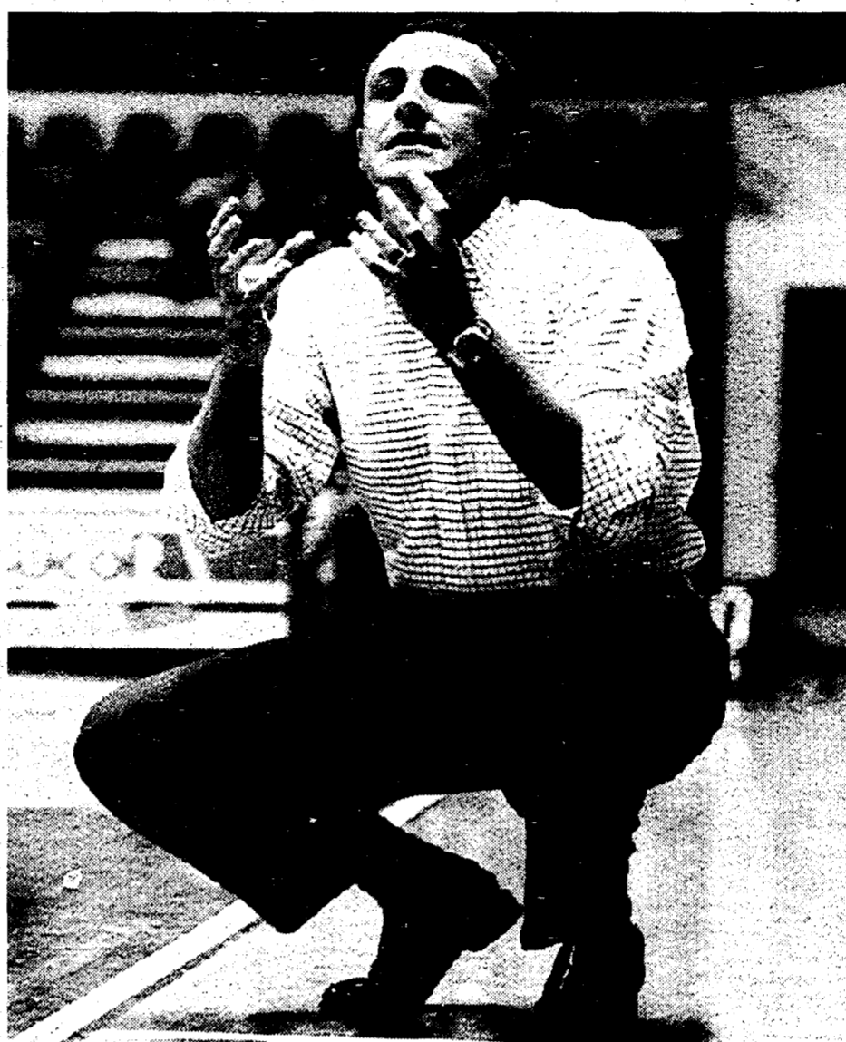
L'allenatore azzurro Ettore Messina

Ma gli osservatori speciali erano soprattutto due, Myers e Fucks, elementi da quintetto-base della Nazionale per gli Europei (che, come noto, saranno validi anche come qualificazione alle Olimpiadi di Atlanta). «Dobbiamo recuperare alla migliore condizione sia Myers che Fucks», continua Messina, «perché sono due elementi sui quali ho grande fiducia. Ma questa fiducia deve essere supportata anche da loro». Al rientro in Italia, il rompete le righe. Dopodomani per gran parte degli azzurri è già campionato, con il doppio anticipo Buckler-Benetton e Scavolini-Filodoro. La Nazionale tornerà in campo il 18 gennaio, al Forum di Assago, nella partita per festeggiare Dino Meneghin e Mike D'Antoni. Avrà di fronte la Stefanel con i due campioni del passato. Ettore Messina non potrà disporre dei giocatori impegnati nell'Euroclub e in Coppa Europa mentre avrà quelli delle squadre di Korac, anche se dalla Stefanel potrà prelevare poco per non togliere competitività al confronto.